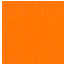
208 hellorange / bright orange