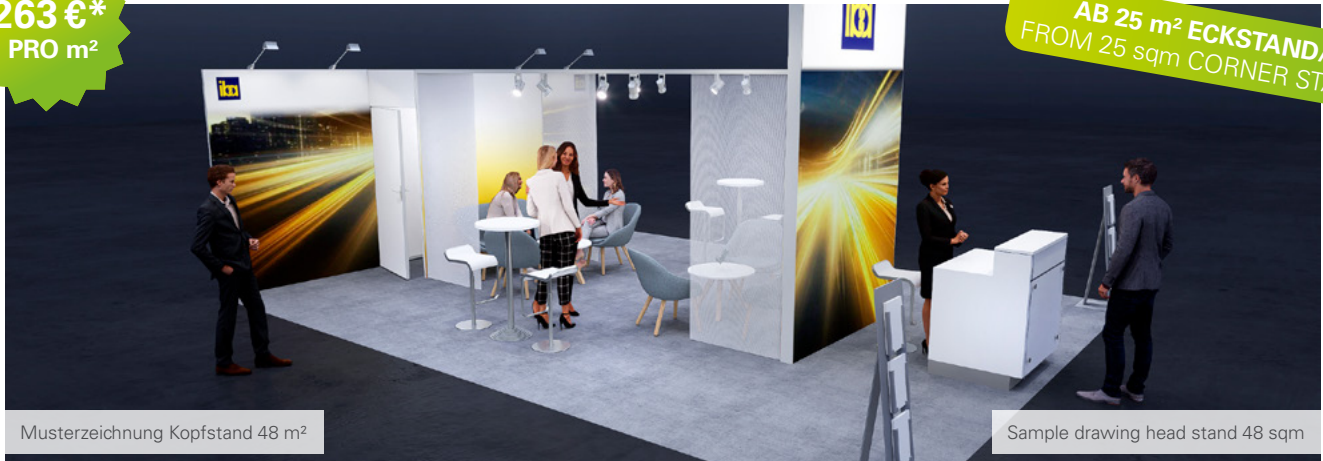
Musterzeichnung Kopfstand 48 m 2

AB 25 m 2 ECKSTAND/ FROM 25 sqm CORNER STAND