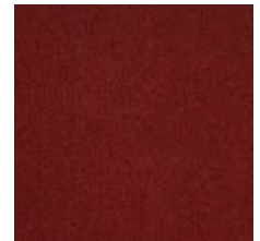
305 weinrot / wine red