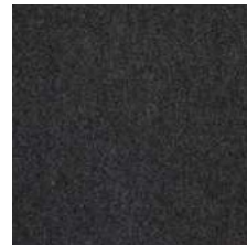
721 schwarzgrau / black grey