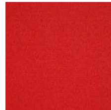
320 rot/ red