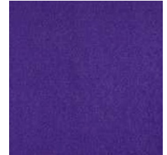
408 violett / violet