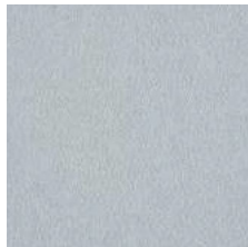
701 silbergrau / silver grey