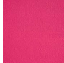
410 magenta / magenta