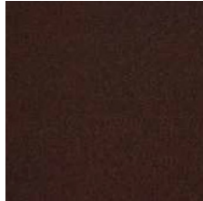
817 dunkelbraun / dark brown