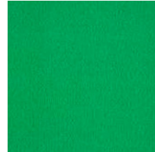
638 leuchtgrün / bright green