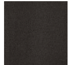
716 anthrazitgrau / anthracite grey