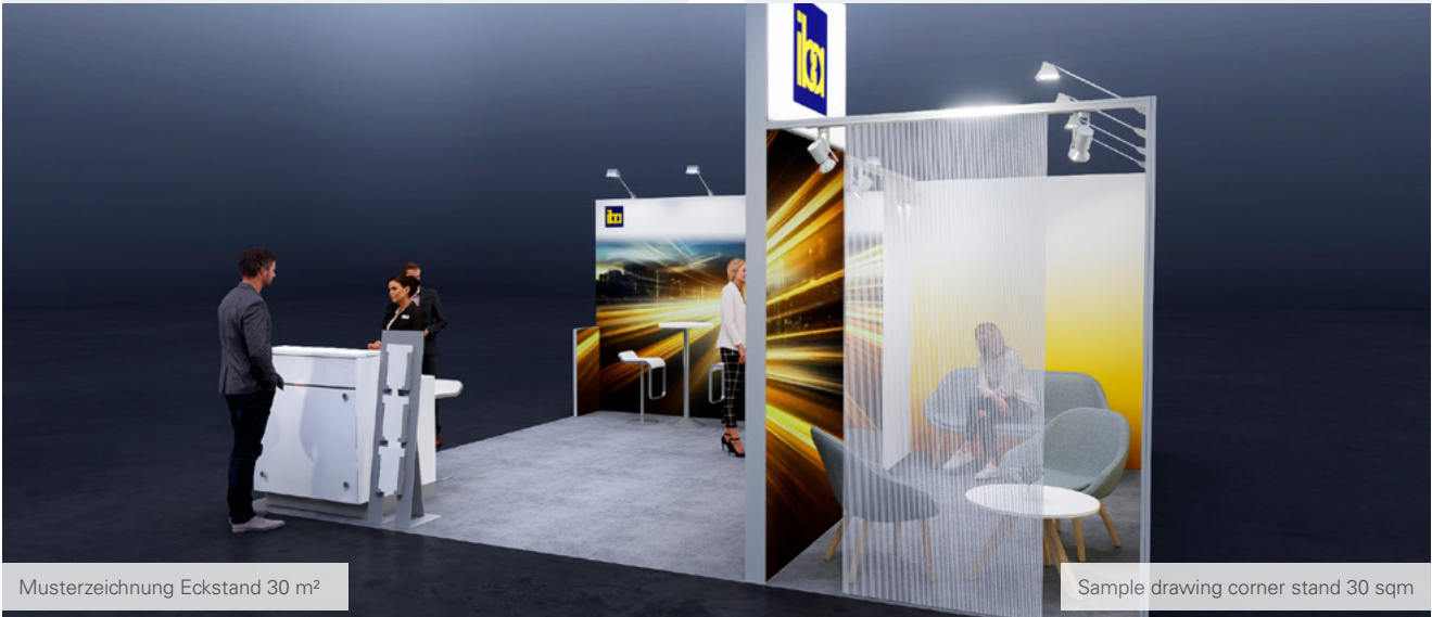
Musterzeichnung Eckstand 30 m 2