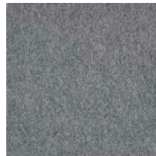
715 schiefergrau / slate grey