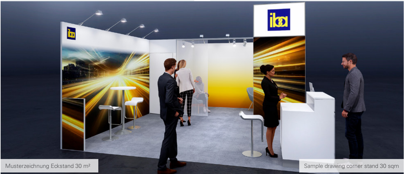
Musterzeichnung Eckstand 30 m 2