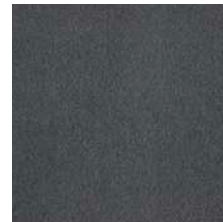
724 graphitgrau / graphite grey