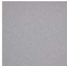
704 grau / grey