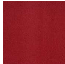
303 rubinrot / ruby red