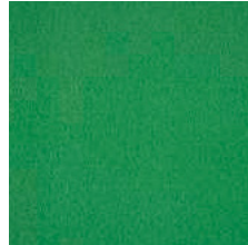
617 maigrün / may green