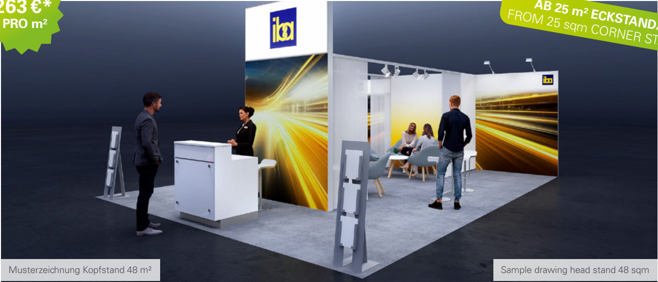
Musterzeichnung Kopfstand 48 m 2

AB 25 m 2 ECKSTAND/ FROM 25 sqm CORNER STAND