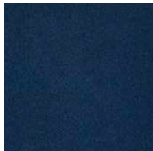
513 kobaltblau / cobalt blue