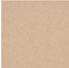
101 beige / beige

Länge: ca. 50 lfm, Breite: ca. 200cm, Brennwert: Bfl-s1 / Length: approx. 50 lin. m., width: approx. 200cm, heating value: Bfl-s1